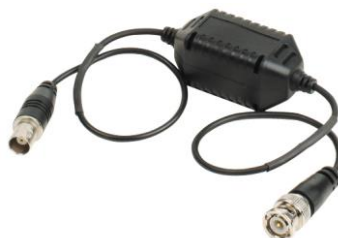
Рис.1 Внешний вид GL001H